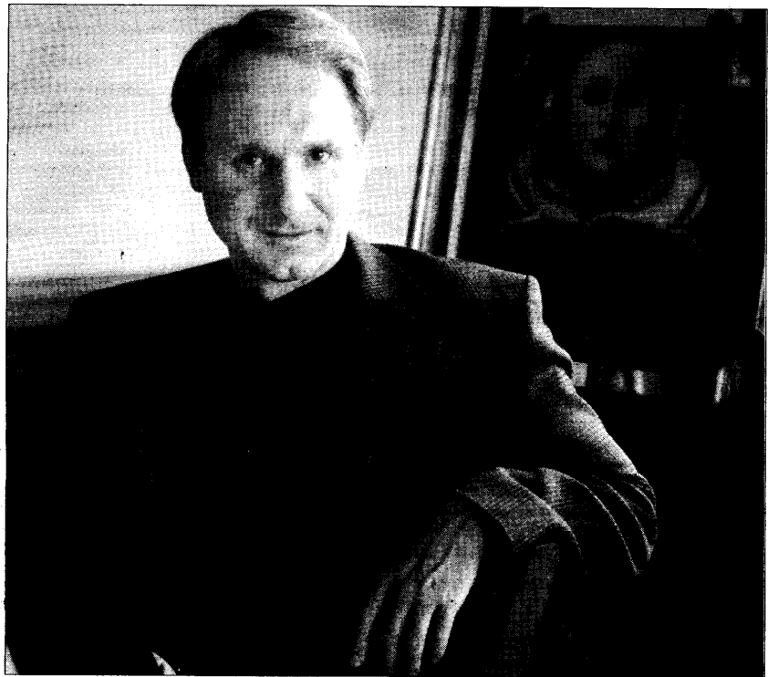
POLÉMICO. Dan Brown dibuja una Sevilla tercermundista en el libro que hoy sale a la venta.

La Fortaleza Digital es la primera novela firmada por el autor de El Código Da Vinci , Ángeles y Demonios y La Conspiración , Dan Brown, aunque es la última que llega a España. Hoy sale a la venta este libro que, ambientado en Sevilla en la década de los noventa, ofrece una imagen de la ciudad con un sistema sanitario tercermundista, cuerpos de seguridad corruptos y un emblema, la Giralda, en el que el visitante se juega la vida... Menos mal que el autor vivió un año en Sevilla durante su época de estudiante, y quedó prendado de la ciudad. Si no ¿qué habría escrito? La experiencia vivida la recuerda en un tono muy diferente: "Durante aquel año me enamoré de la ciudad y sobre todo de su gente. De hecho he regresado allí en cuatro ocasiones, que es más de lo que he vuelto a visitar ninguna otra ciudad de Europa".